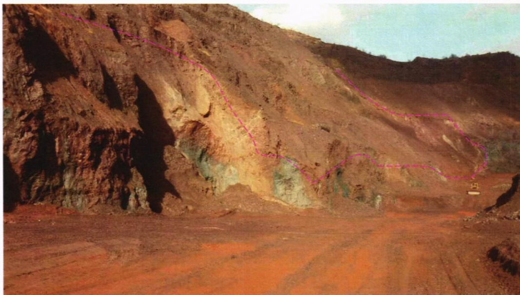
Фото 4. Порушені породи рудного покладу 5-го залізного горизонту унаслідок їх попереднього розпущення та розкриття кар'єром. В результаті зсувних процесів порушені породи лежать на західному борту кар'єру Південний.

За результатами обстеження можна зробити висновок, що гірничотехнічні умови розробки запасів у межах ділянки №2 є надзвичайно ускладненими внаслідок техногенного впливу на надра інтенсивного просідання поверхні внаслідок підземної розробки родовища, з повним обваленням вміщуючи порід у відроблений простір утворення депресійної воронки у горизонті підземних вод, а також формування відвалів пустих порід.