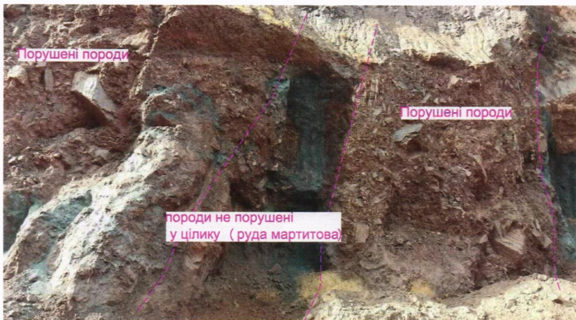
Фото 3. Порушені породи рудного покладу 5-го залізного горизонту. В центрі чітко виділяються корінні породи, а по краях порушені породи унаслідок їх попередньої відробки шахтним способом.