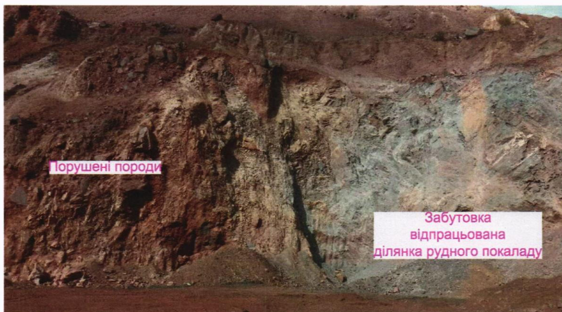
Фото 2. Порушені, за рахунок попередньої розробки шахтним способом породи рудного покладу у межах 5-го залізистого горизонту та забутована ділянка у межах виробленого простору. Виробки датовані до 1941 року. Ділянка №2 кар'єр Південний.